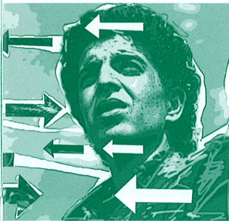
Tekening: Hans Sprangers

veel allochtonen een probleem dat politie en justitie moeten oplossen.